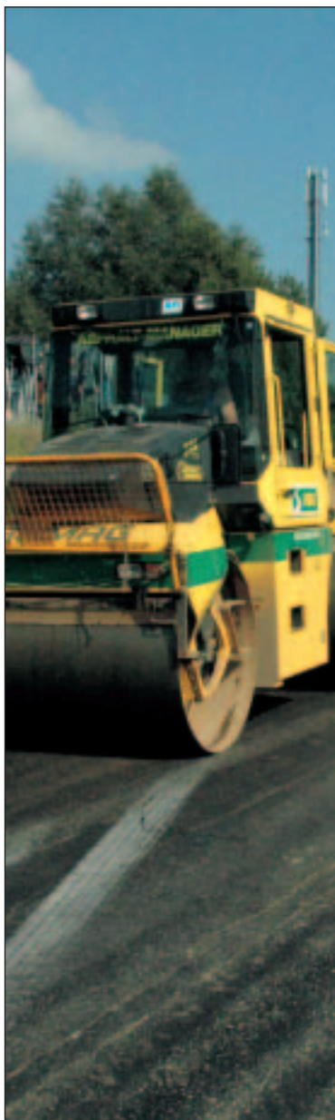
:"De omleidingsweg rond Rumst zal de verkeerssituatie in het centrum aanzienlijk verbeteren"

Belangrijk voor onze gemeente is ook nog de omleidingsweg rond Rumst. Fase 1 (rond punt Moës) en fase 2 (Catenbergstraat) werden reeds gerealiseerd (zonder belastingsgeld). Daardoor werd de Hollebeekstraat reeds verkeersluw en halveert het zwaar verkeer in de Tuinwijk. Fase 3 (de weg over OTL naar de brug over de E 19) moet nu worden aangepakt. De Vlaamse overheid kan dan zorgen voor de aansluiting op de E 19 ( fase 4). In de tussentijd vraagt CD&V /N-VA begeleidende maatregelen voor het onderliggend wegennet.