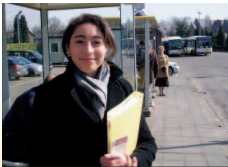
Het gratis abonnement is een aanzienlijke besparing voor mij

keerslichten zoals in de Eikenstraat, de Tuinwijk en de Kapelstraat.