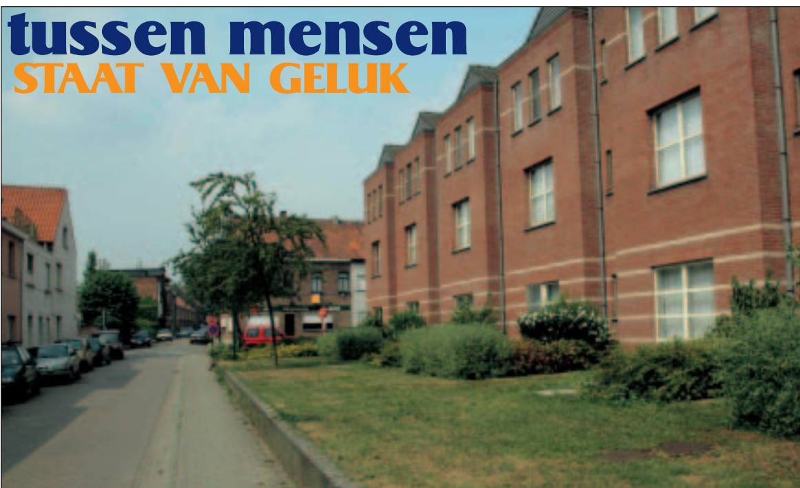
De 50 serviceflats van het Hof van Crequi zijn alomtewees gewaardeerd. De bewoners zijn er zeer tevreden

Het OCMW bestrijdt ook lokale kansarmoede door lokale projecten voor noodhulp, woningaanpassingen, ondersteuning bij studiekosten.