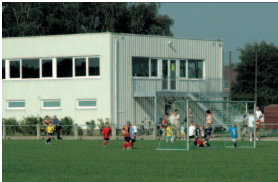
Reet SK heeft nu een mooi clubhuis

minstens behouden blijven en daar waar nodig afgestemd worden op de behoeften van de jongeren. CD&V/N-VA blijft ook voorstander van de bouw van een sportschuur aan de Processieweg. De voorbije jaren werden de eerste stappen gezet om deze realisatie mogelijk te maken. Door het verplaatsen van de voetbalterreinen is er ruimte vrijgekomen. Via een bijzonder plan van aanleg heeft deze ruimte ook de juiste bestemming gekregen. Igean maakte een studie naar de haalbaarheid van een publiek private samenwerking voor de realisatie van dit project. Pétanque is één van de favoriete sporten voor senioren. Er werden in het verleden al heel wat pétanquebanen aangelegd in de verschillende wijken van onze gemeente. De aanleg van bijkomende terreinen en de uitbouw van de bestaande infrastructuur staan zeker op ons programma.