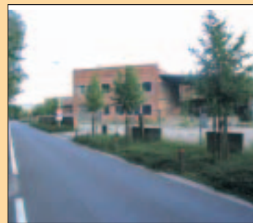
Op de site Heylen komen nieuwe woningen en appartementen