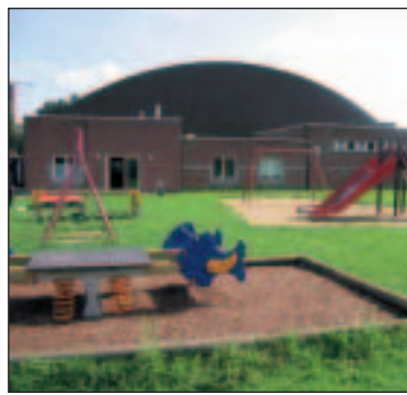
Recent investeerde de gemeente in de sporthal uitgedekt schoo

De sportdienst ontwikkelde initiatieven die sportbeoefening stimuleren, vb. sport op school, sportkampen, zwemmen, sportinitiatie, sport overdag, senioren sport enz. De gemeente ondersteunt sportieve activiteiten zoals wandelingen, joggings, zwembeurten, wielervedstrijden en fietstochten. Sportverenigingen ontvangen materiële ondersteuning of subsidies. De gemeente levert extra inspanningen voor de jeugdwerking in de sportclubs. Voor niet georganiseerde jeugd zijn er