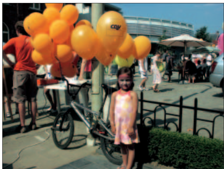
"De gemeente zorgt al verschillende jaren voor woon-schoolvervoer voor alle kinderen van alle scholen"

Elk kind telt. Geen twee kinderen zijn hetzelfde. Het respect voor de eigenheid van elk kind is de dieperliggende achtergrond van onze onderwijsvisie. Het basisonderwijs is bepalend voor de rest van de (school)carrière. Het basisonderwijs is een belangrijke partner, met name omdat het een cruciale hefboom is in de opbouw van het lokale sociale weefsel.